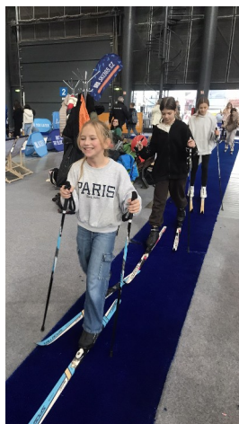
MS ve stepu

Naši žáci také navštívili sportovní veletrh Sportlife, basketbalové utkání KP TANY Brno – Galatasaray Istanbul (TUR), kde o přestávce předvedli zápasnickou exhibici a Utkání legend Českého hokeje & fotbalu proti legendám Komety Brno.