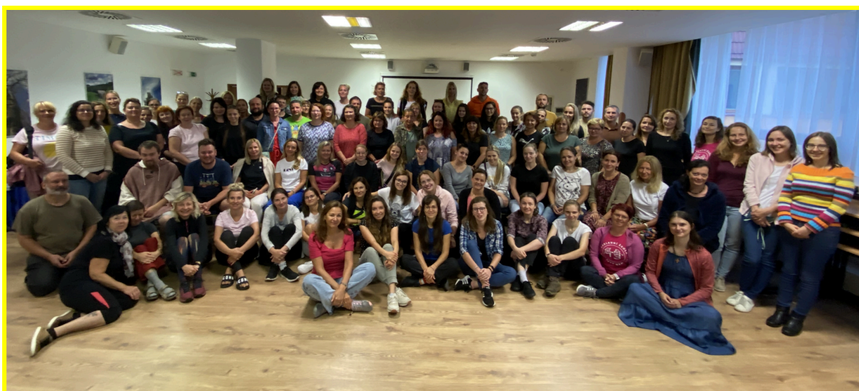
Sbor pedagogů a asistentů

Školní rok 2023/2024 začal, podobně jako v předchozích letech, pro většinu pedagogů, vychovatelek a asistentů pedagoga přípravným týdnem. Kromě ožívání pracovních, ale i přátelských vztahů na pracovišti, příprav tříd a prostor školy, porad, školení, dokumentace, plánování, jsme se vydali do klidných koutů na Vysočinu, abychom zde strávili dva dny, 29.-30. srpna, na výjezdním zasedání v hotelu Svratka, kde o nás bývá dobře postaráno, neboť hotel nabízí útulné ubytování, zázemí pro konferenční účely, dobré jídlo a pití, wellness, venkovní posezení a hluboké lesy vybízející k procházkám po blízkém okolí.